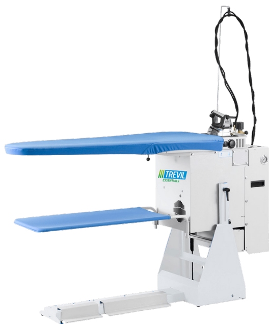
Table à repasser SUPERFLEX 2567