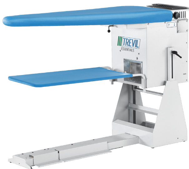
Table à repasser SUPERFLEX 2467